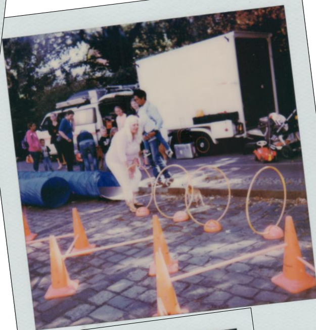
Gute Laune im Kiez!