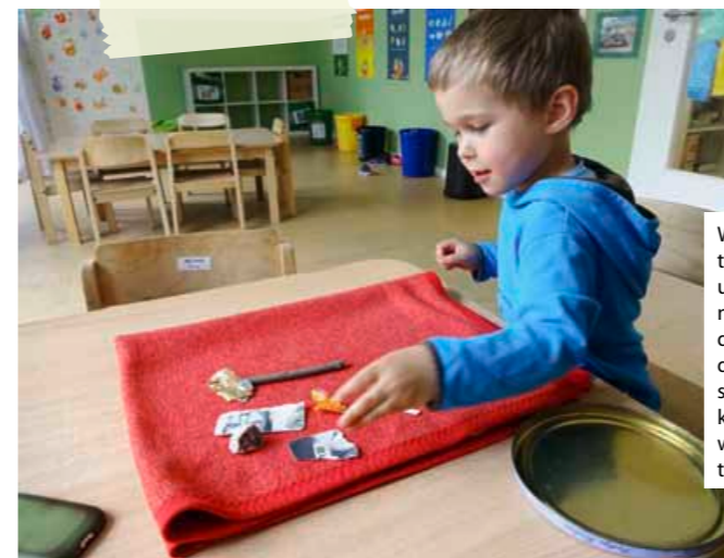
Was soll unten, was oben und was soll nebeneinanderliegen? Jedes Sammelstück bekommt einen wohl gewählten Platz.